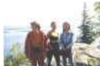
Suomen kielen opiskelijoita Kolilla.